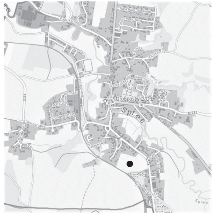
• Standort Bebauungsplan „Am Sonnenberg“