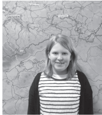
Um allen Anwesenden im Finale eine räumliche Zuordnung der entsprechenden Schulen zu ermöglichen, markierten die Schüler vorerst ihren jeweiligen Heimatort an einer physischen Sachsenkarte

Text und Foto: M. Küchler (FL Geographie)