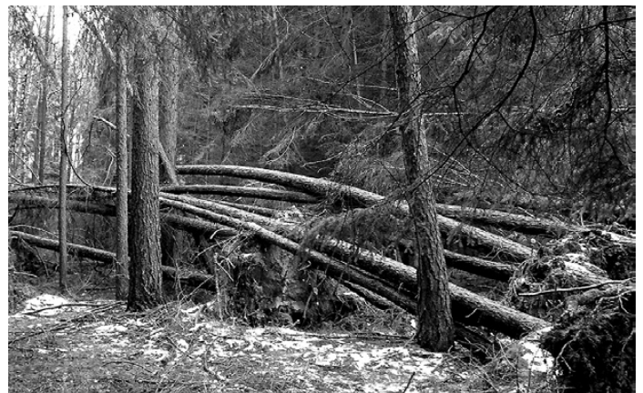
„Wurfneest“ im Wald mit hohem Gefahrenpotenzial.