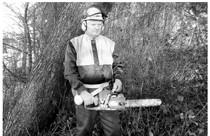
Forstwirt in vorgeschriebener Schutzbekleidung.