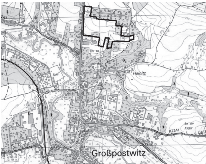
Abb.1: Übersichtskarte Gemeindegebiet