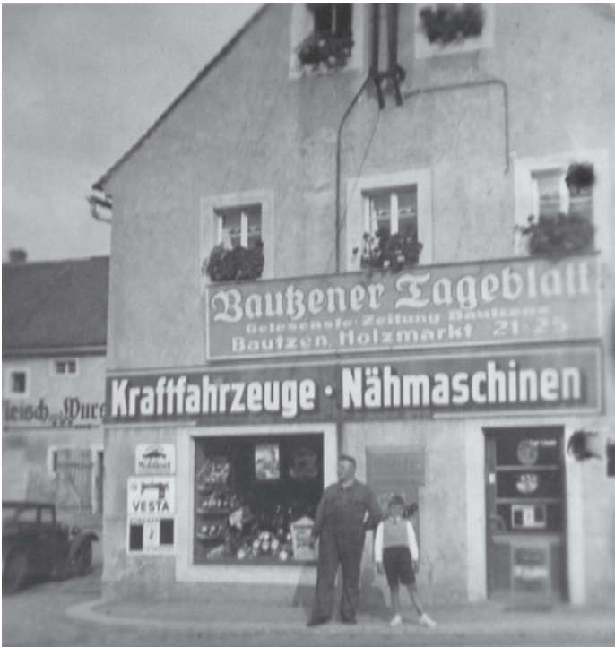
In Großpostwitz gibt es in diesem Jahr wieder ein großes Firmenjubiläum - 90 Jahre Zweiradtechnik Vyhnalek.