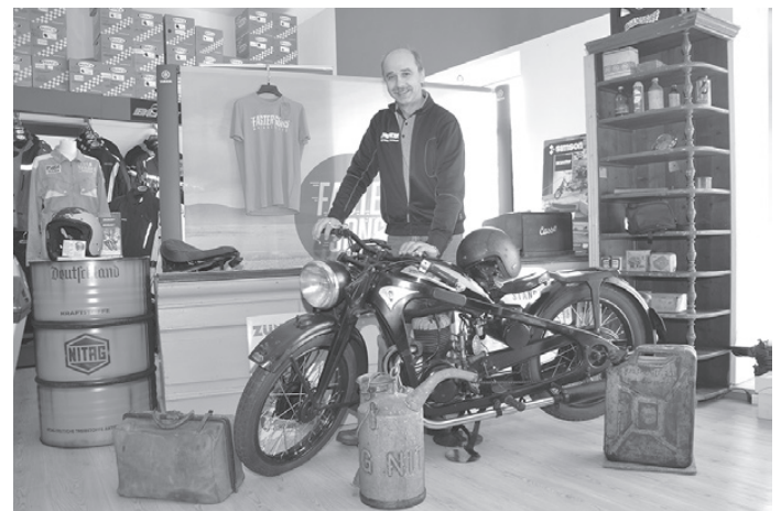
Derzeit erinnern im Geschäft einige historische Stücke an die alten Zeiten.