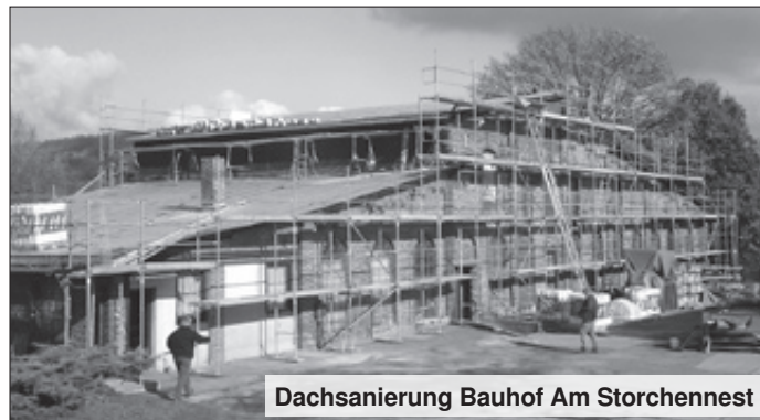
Dachsanierung Bauhof Am Storchennest