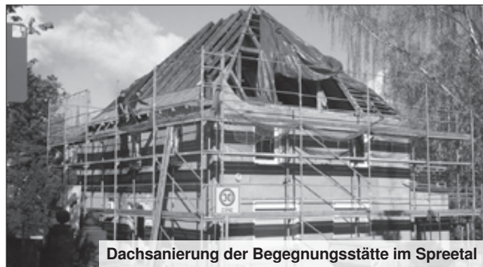
Dachsanierung der Begegnungsstätte im Spreetal