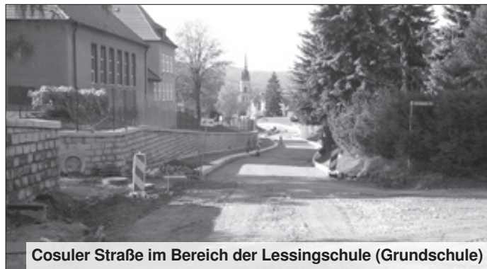
Cosuler Straße im Bereich der Lessingschule (Grundschule)