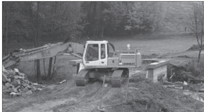
Weitere Bauaktivitäten in unserer Gemeinde:

eine Verkürzung der Bauzeit erreicht, um die Belastung für die Anwohner zu minimieren (geplantes Bauende Juni 2009 !). Es wird angestrebt, das Vorhaben weitestgehend in diesem Jahr abzuschließen. Restleistungen werden noch im Frühjahr 2009 ausgeführt, wobei auch weiterhin mit Einschränkungen zu rechnen ist. Auch im Namen des Landratsamt Bautzen möchten wir uns bei allen betroffenen Anwohnern von Großpostwitz und Cosul für das Verständnis und die gezeigte Kompromissbereitschaft während der Bauarbeiten bedanken.