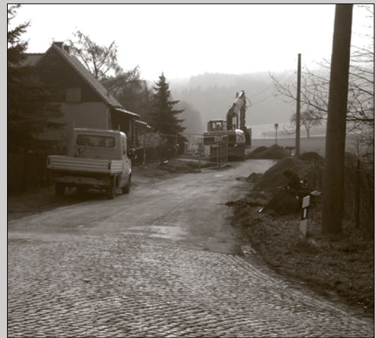
Am 17.03.08 begannen die Arbeiten für den Kanalbau Cosuler Siedlung