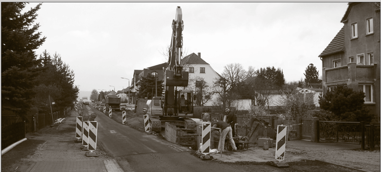
Seit Ende März d.J. werden die Kanalbauarbeiten Oberlausitzer Straße fortgeführt