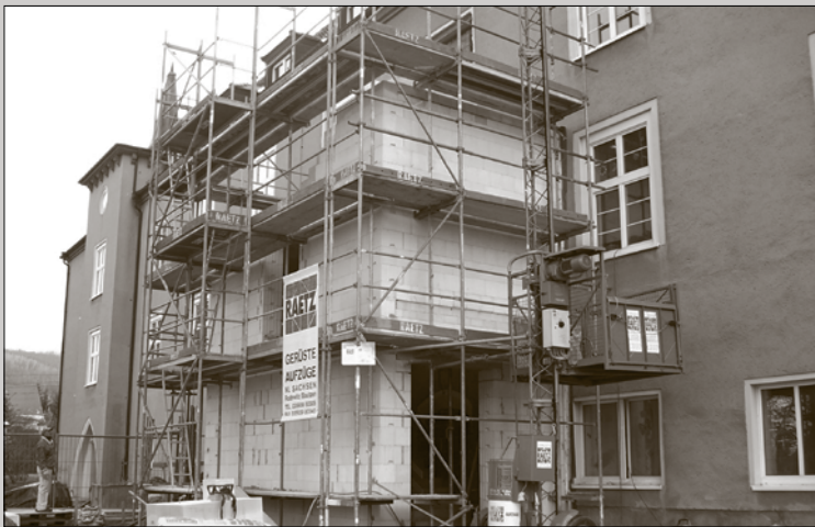
Umbau Lessingschule – Stand der Arbeiten für den Anbau des neuen Treppenhauses